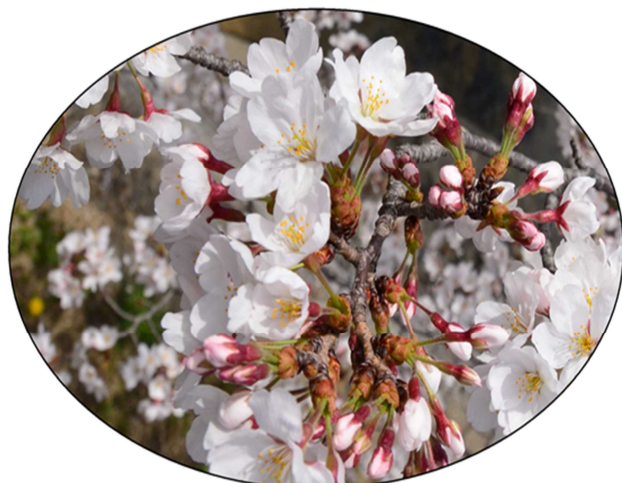
西宮市の花:さくら