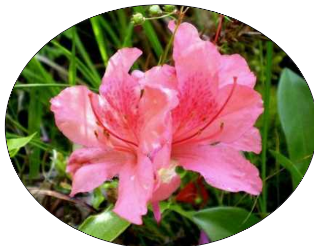
芦屋市の花:小葉の三つ葉ツツジ